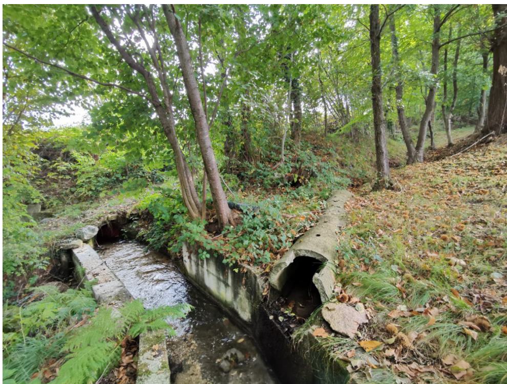
Intersezione ramo centrale Rio Cassere con tubazione di arrivo e sfioratore laterale