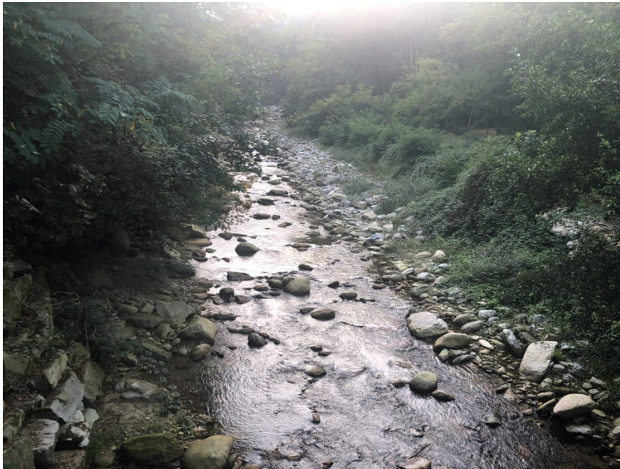
Vista dell'alveo del Torrente Luserna a monte del ponte PEGFPO006