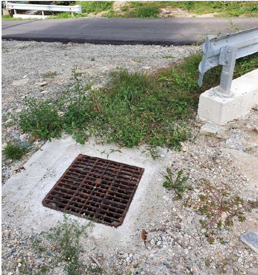
Pozzetto tratto intubato in corrispondenza intersezione Via Vista e Rio Comba La Losa