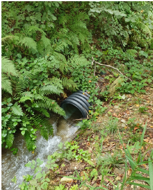
Canale intubato in PEAD diam. 600 mm – sbocco zona monte Loc. Possetti