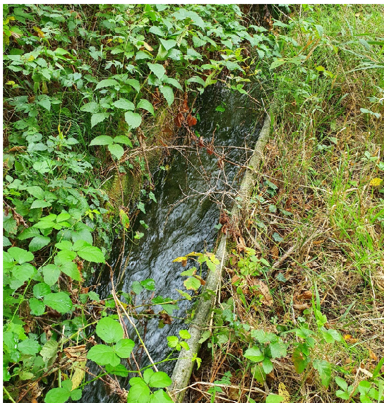
Canale a cielo aperto – tratto iniziale zona via Traversero