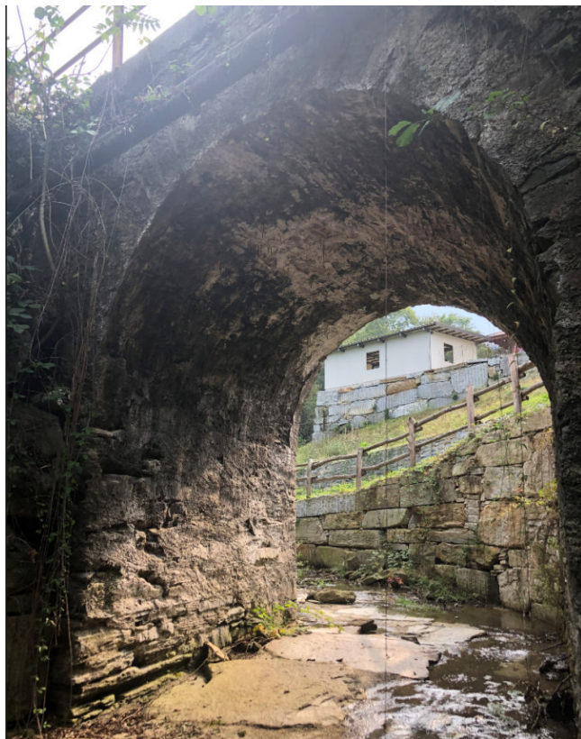
Vista da valle verso monte del ponte sul Rio Serbial PEGFPO002