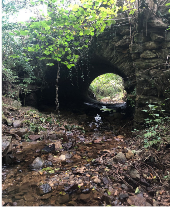
Vista da monte verso valle del ponte sul Rio Serbial PEGFPO003