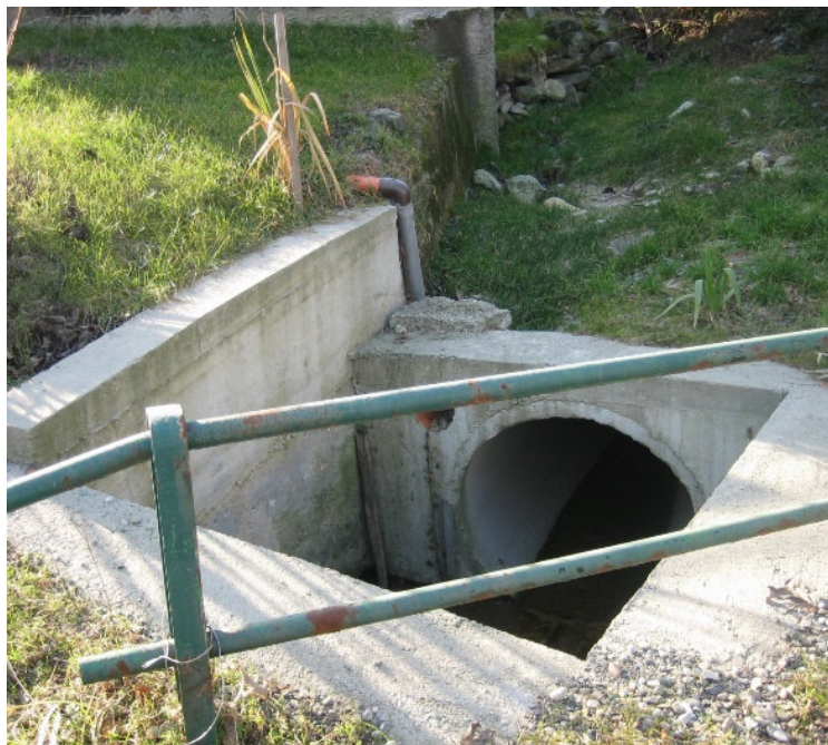
Vista da valle verso monte dell'attraversamento del Rio Cassere PEGFPO011