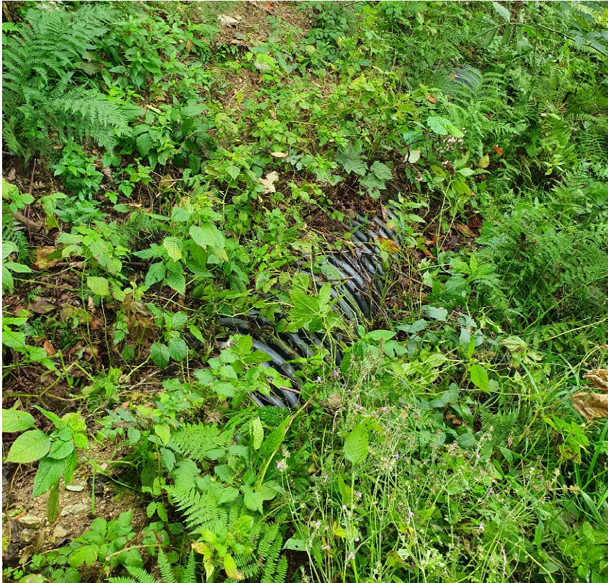
Canale intubato in PEAD diam. 600 mm – zona monte Loc. Possetti