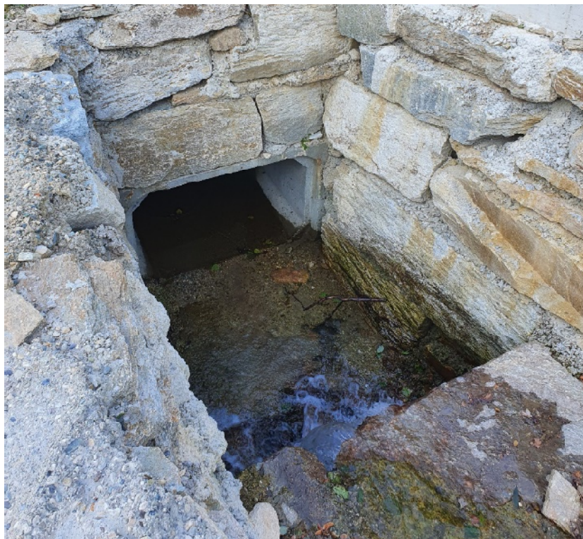
Vista da monte verso valle dell'attraversamento del Rio Comba La Losa PEGFPO013