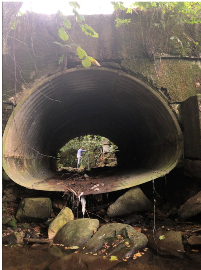
Vista da valle verso monte del ponte sul Rio Serbial PEGFPO003