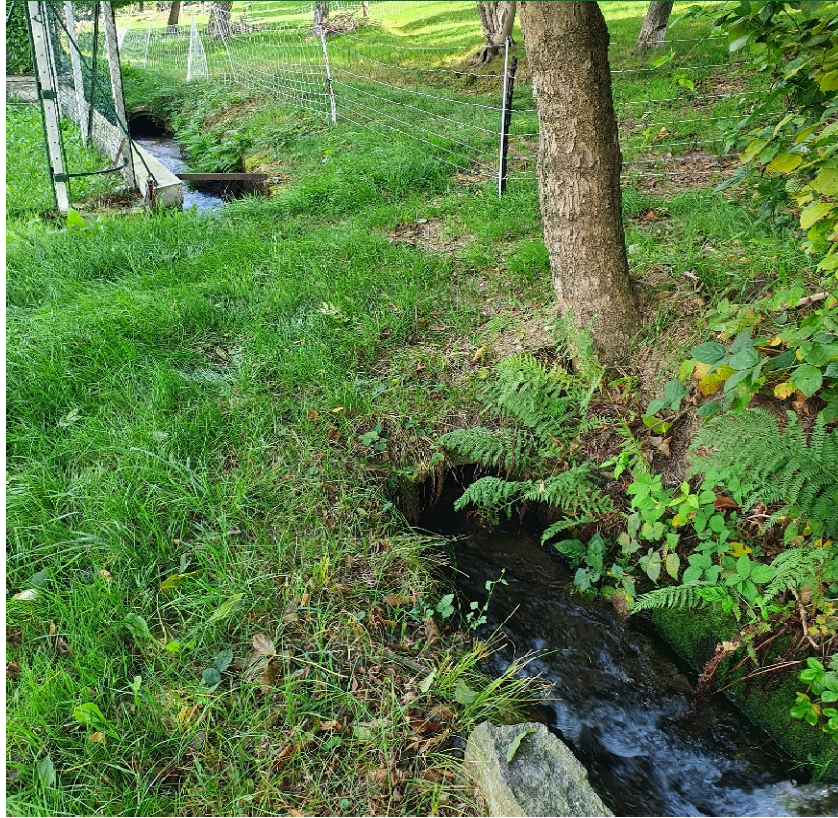
Canale a cielo aperto a monte del paese