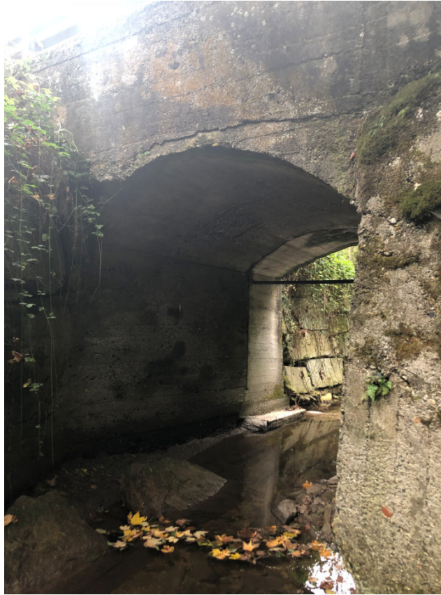
Vista del ponte sul Rio Serbial PEGFPO004