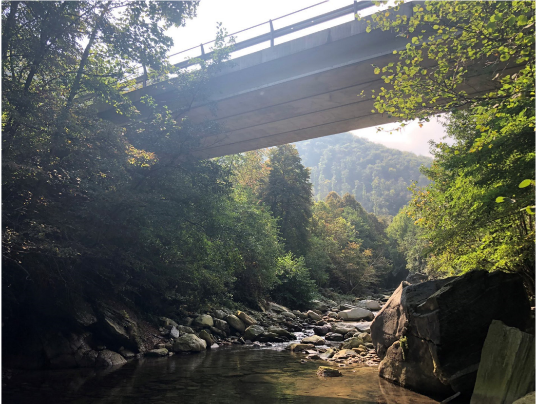
Vista da valle verso monte del ponte sul Torrente Luserna PEGFPO009