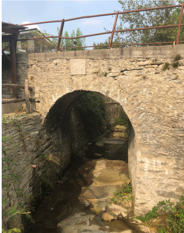
Vista da monte verso valle del ponte sul Rio Serbial PEGFPO002