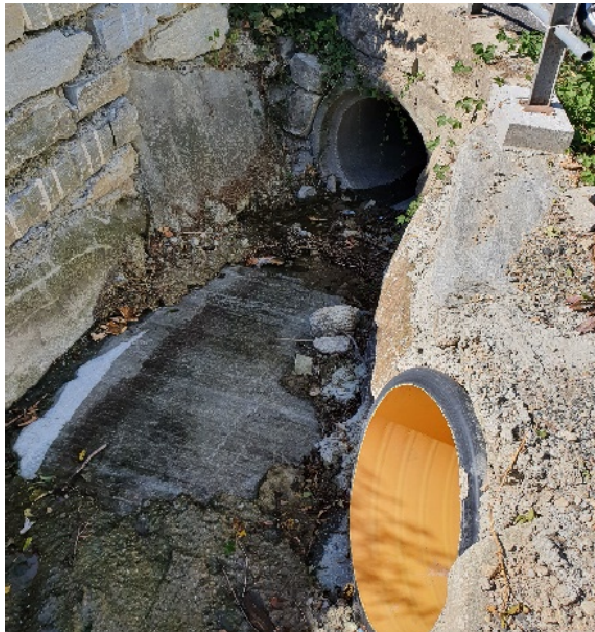
Vista da monte verso valle dell'attraversamento del Rio Comba La Losa PEGFPO012