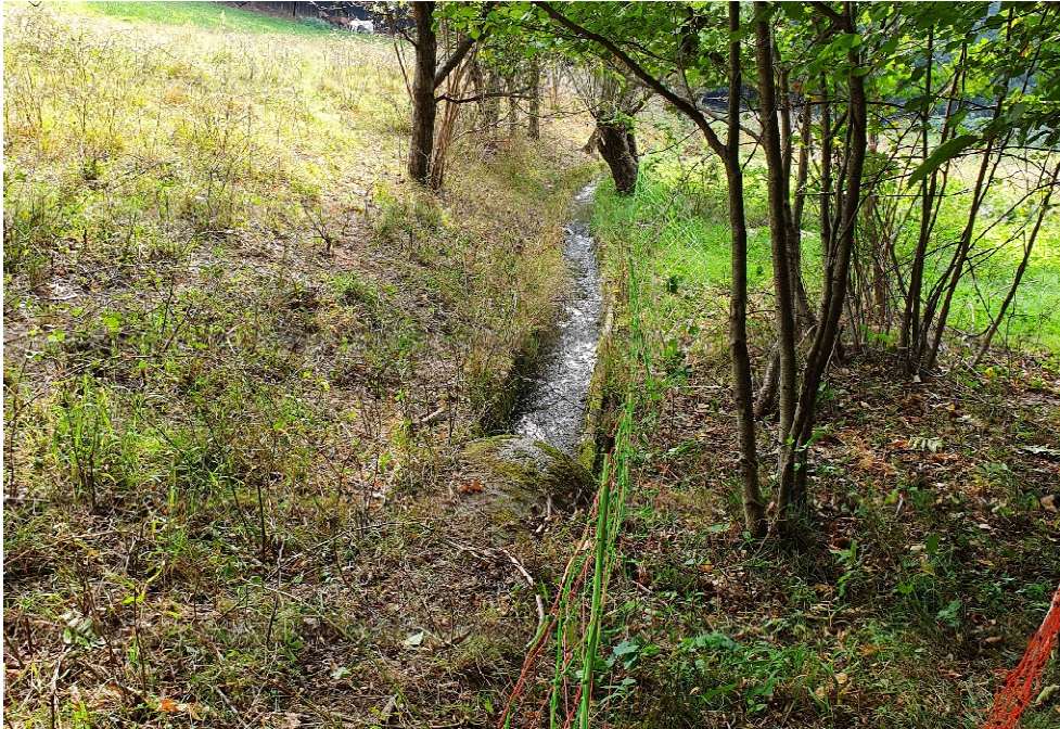
Canale a cielo aperto – monte zona Cascina Marsaglia sez. n. 9