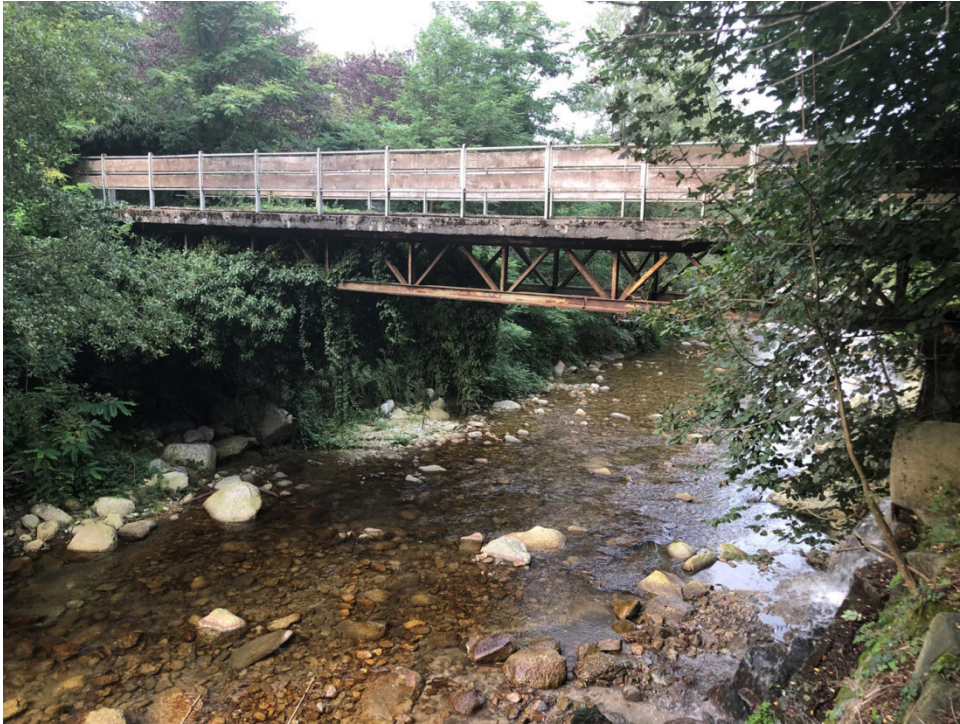
Vista da monte verso valle del ponte PEGFPO006