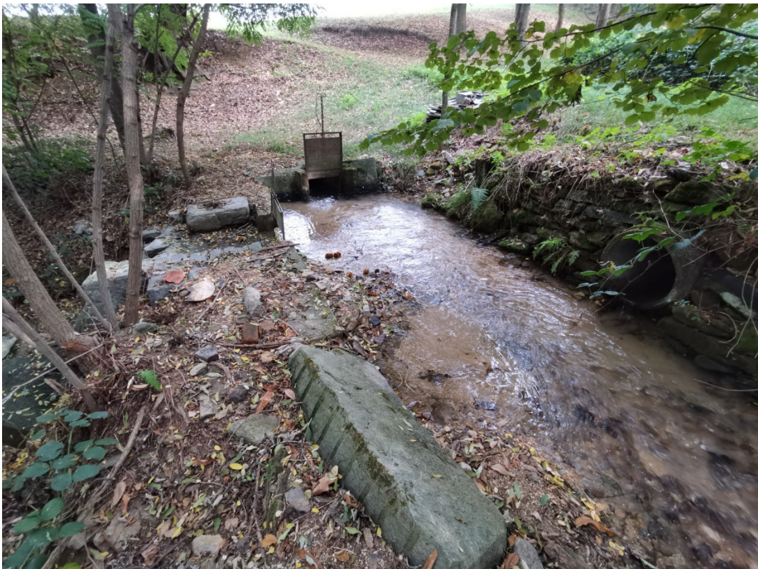
Intersezione ramo destro Rio Cassere con Canale del Becetto con sfioratore laterale