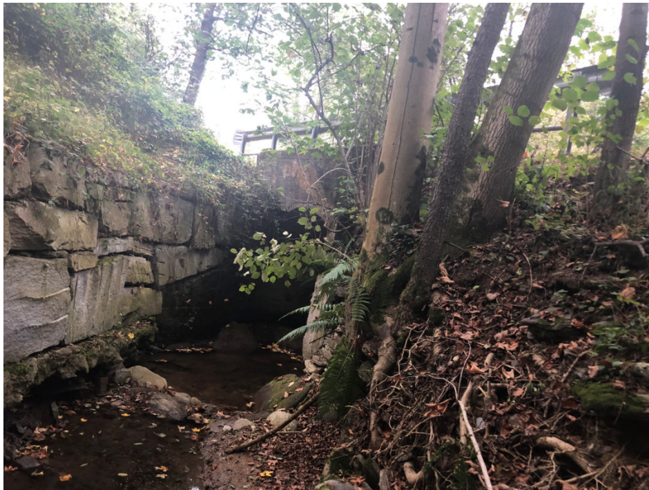
Vista della sezione a monte del ponte sul Rio Serbial PEGFPO004