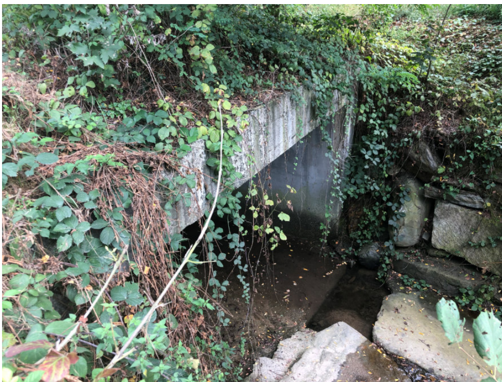
Vista a monte del ponte sul Rio Serbial PEGFPO001