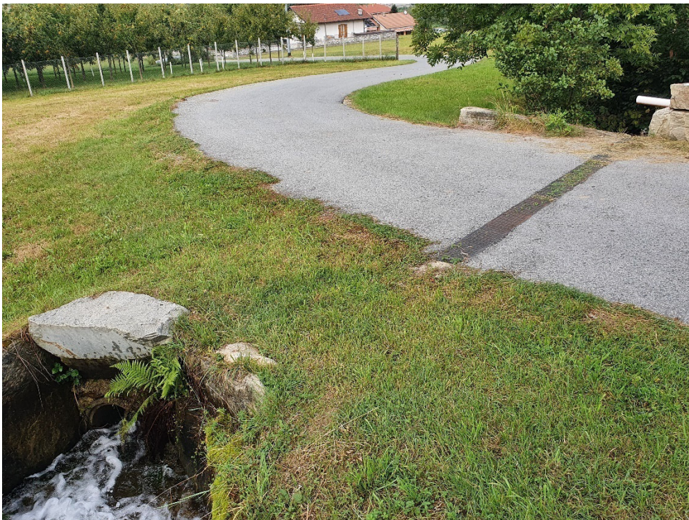
Intersezione strada accesso Borgata Bricco (Via Viassa)