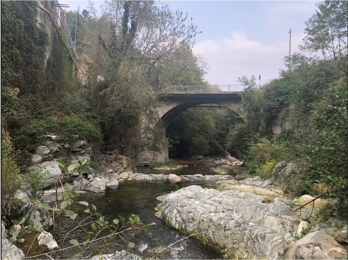
Vista da monte verso valle del ponte sul Torrente Luserna PEGFPO005