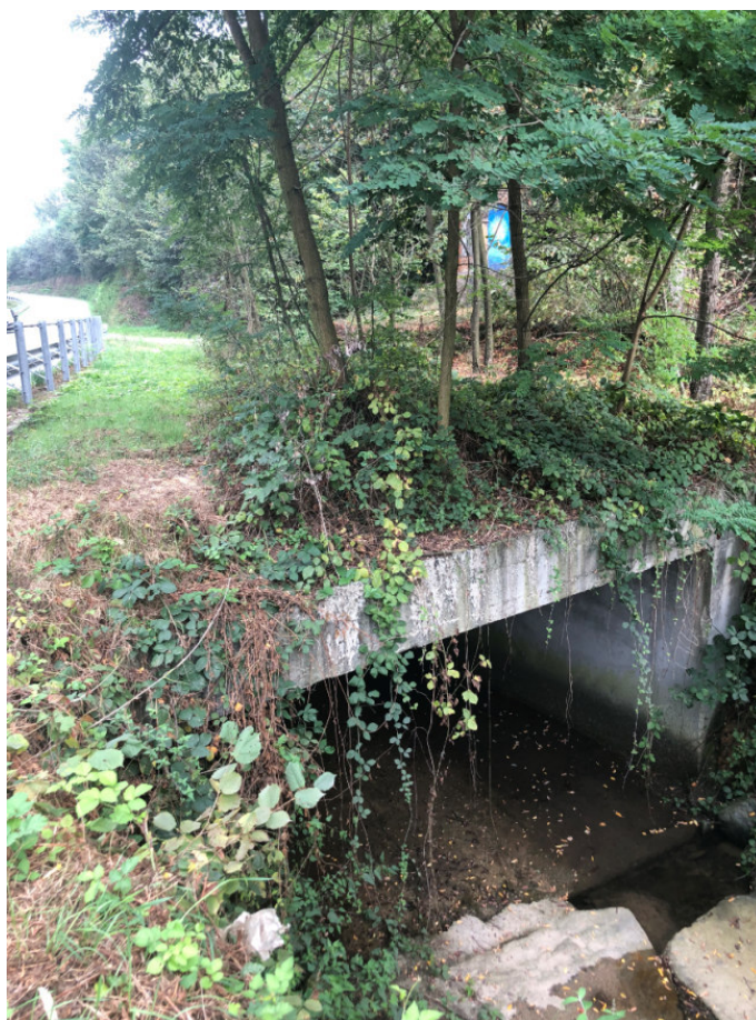
Vista a monte del ponte sul Rio Serbial PEGFPO001