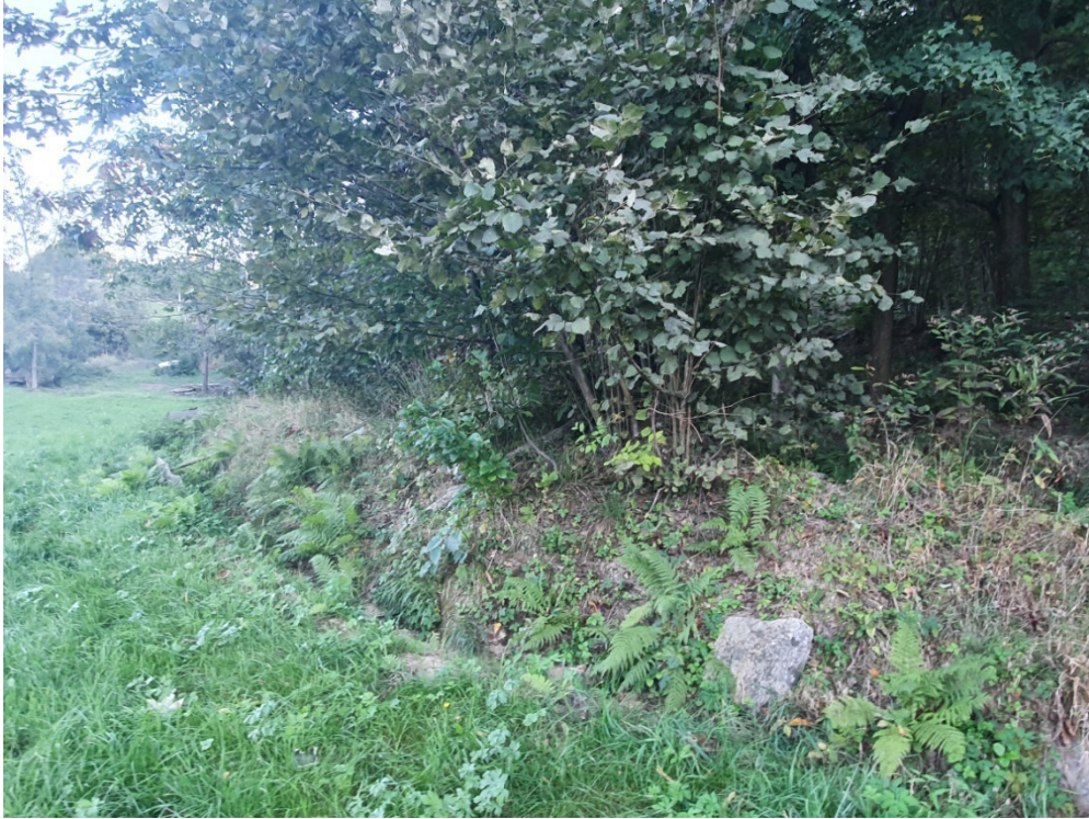
Canale a cielo aperto – tratto a monte attraversamento via Vista in cui confluisce il bacino di versante