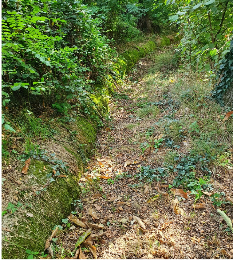
Tratto intubato a monte Cascina Marsaglia