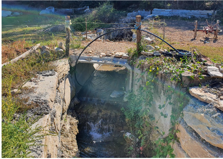
Vista da valle verso monte dell'attraversamento del Rio Comba La Losa PEGFPO014