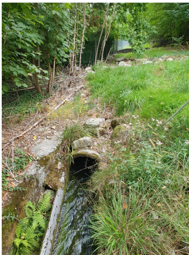
Imbocco tratto intubato – zona monte Loc. Possetti